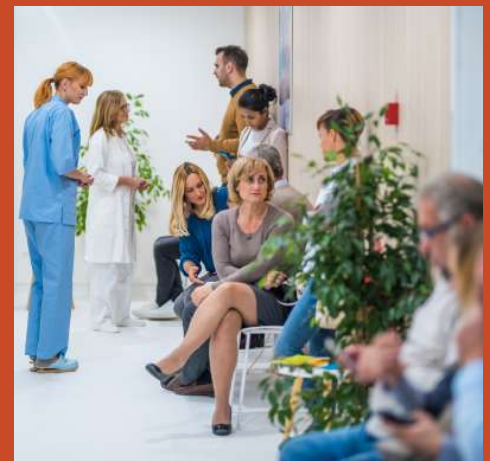
SOINS NON PROGRAMMÉS