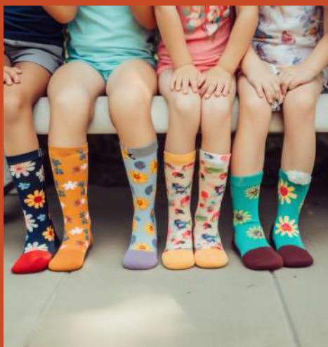
TROUBLES DU NEURODÉVELOPPEMENT