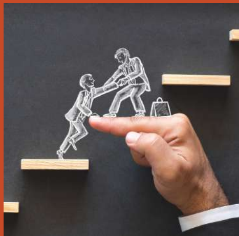
ACCOMPAGNEMENT DES CARRIÈRES