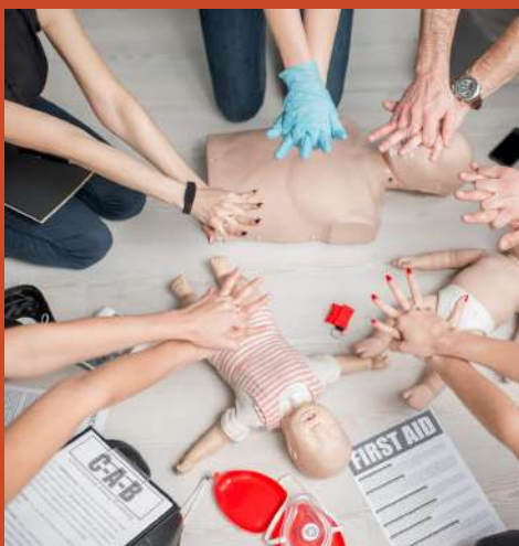
SITUATIONS DE CRISE